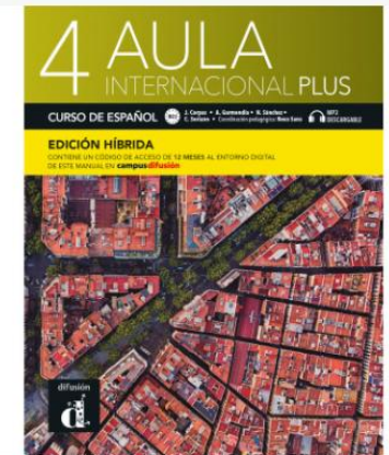
Aula internacional Plus 4 - Edición híbrida - Libro del alumno