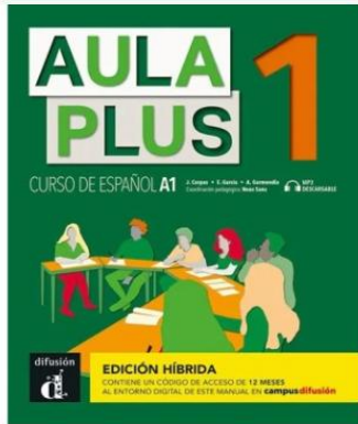
Aula Plus 1 - Edición híbrida - Libro del alumno