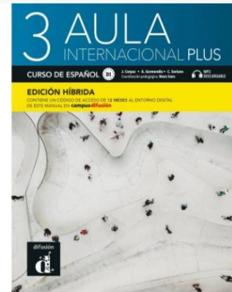
Aula internacional Plus 3 - Edición híbrida - Libro del alumno